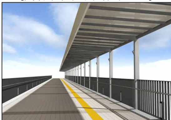
[区画デッキ (Aデッキ) イメージ]