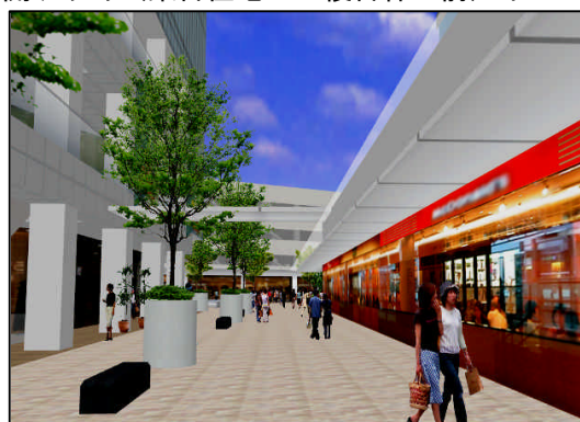
[公開デッキ (集合住宅A・複合棟A前) イメージ]