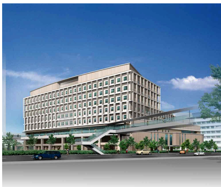
[福祉棟 完成予想図（南東側）]