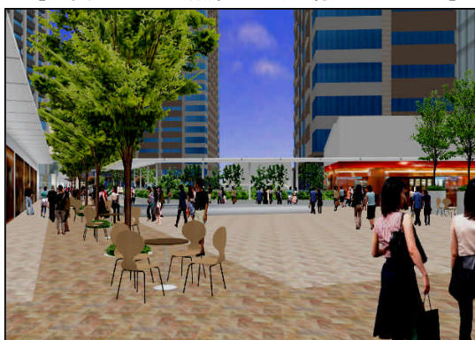
[公開デッキ (賑わいの広場) イメージ]