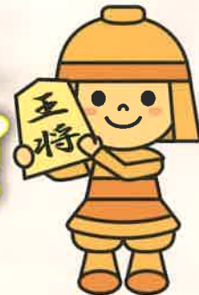
高槻市マスコットキャラクター「はにたん」