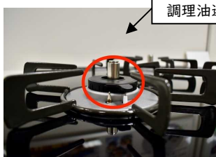
調理油過熱防止装置

小径で本体重量が軽量なものの場合、ガスこんろの調理油過熱防止装置がなべ底を押し上げて傾いたり、落下したりするおそれがあります。取っ手の向きや、五徳のツメの向き、本体の位置等にも注意して、取っ手を持ちながら使用しましょう。