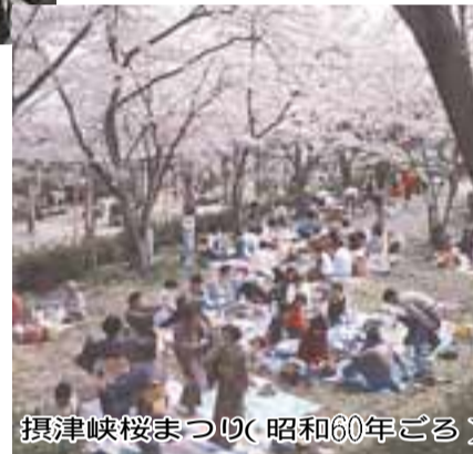
摂津峡桜まつり(昭和60年ごろ)

また、61年には陸上競技場が完成し総合スポーツセンターがオープン、平成4年には文化ホールの開館、高槻シティマラソンの開催や、6年には中央図書館、生涯学習センターが併設された総合センターが完成。10年には萩谷総合公園がオープンなど、文化やスポーツなどの施設が充実し、ゆとりと潤いのある市民生活の実現に向け、まちづくりを進めました。