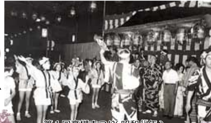
第1回高槻まつり(昭和45年)