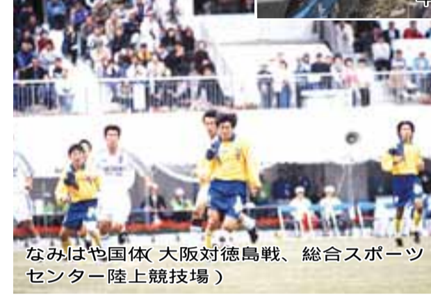
なみはや国体(大阪対徳島戦、総合スポーツセンター陸上競技場)