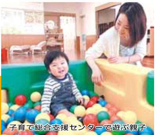
子育て総合支援センターで遊ぶ親子