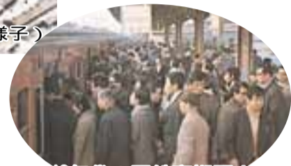
昭和40年代の国鉄高槻駅ホーム

昭和40年代は人口が急増し、44年に20万人、48年には30万人を突破しました。この急激な変化に対応するため、10年間で小学校17校、中学校7校を建設。また、市役所庁舎(現本館)、市保健センター、高槻島本夜間休日応急診療所など公共施設の整備が進みました。50年代に入り、国鉄再開業事業により高槻駅の橋上化など都市基盤の本格的な整備に取り組み始めました。