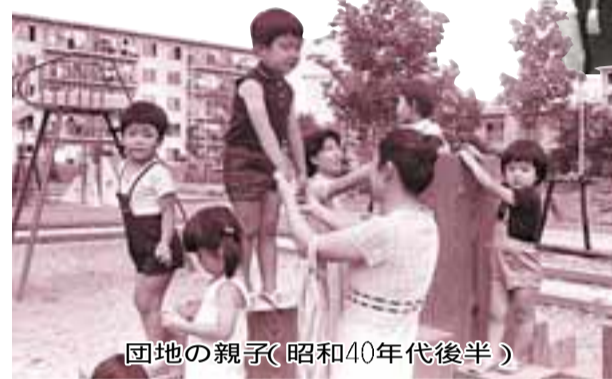
団地の親子(昭和40年代後半)

高槻市は、昭和18年1月1日に大阪府内9番目の市として誕生。今年で市制施行70周年を迎えました。当初は3万人余りだった人口は現在では35万人を超え、4月には中核市移行10周年を迎えます。