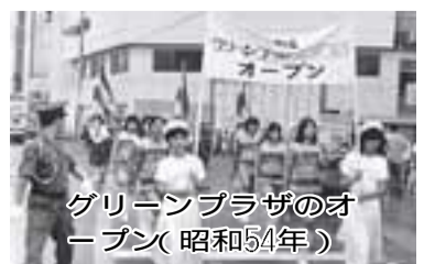
グリーンプラザのオープン(昭和54年)