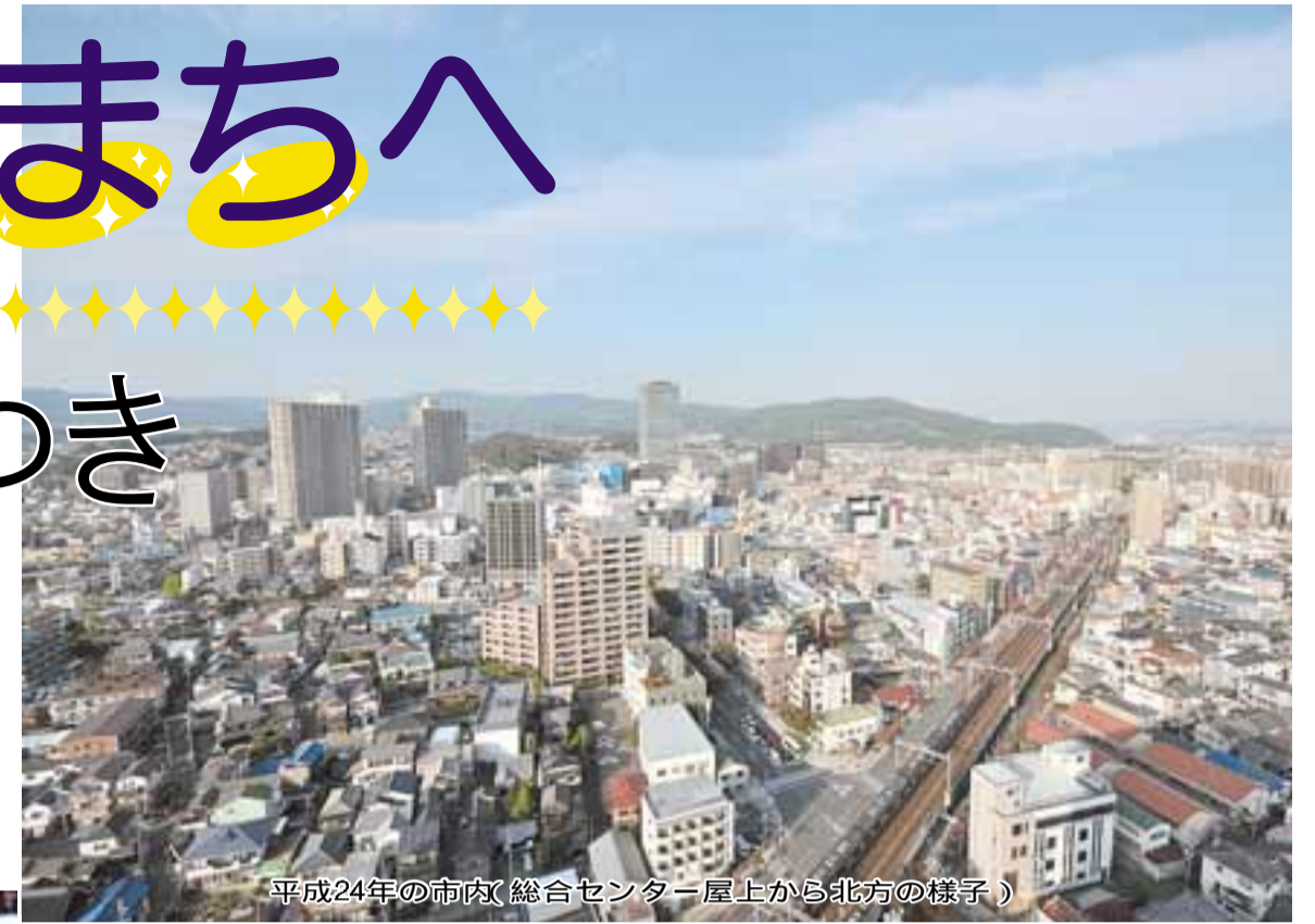
平成24年の市内(総合センター屋上から北方の様子)