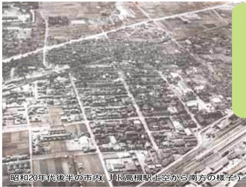
昭和20年代後半の市内( JR高槻駅上空から南方の様子)