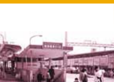
阪急高槻市駅前(昭和57年)