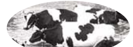
昭和55年ごろまで行われていた三箇牧での乳牛の放牧