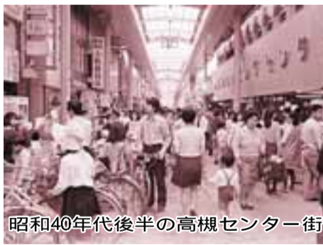
昭和40年代後半の高槻センター街

都市基盤がおおむね整備された近年は、安心して生活できる環境の充実に向けて、安全・安心のまちづくりを進めています。18年には24時間365日救急車に医師が同乗して現場に向かう特別救急隊の本格運用を開始し救急医療体制を拡充。また22年には、古曽部防災公園を開設。同公園は通常はスポーツ施設、災害時は広域避難所として使われる施設です。23年には、防災拠点となる消防本部庁舎棟の建て替えが完了。消防ヘリコプターが撮影した現場の映像をリアルタイムで確認できるシステムなどを導入した高機能消防指令センターが稼働しました。