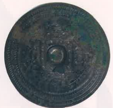
国指定重要文化財 安満宮山古墳 「青龍三年」方格矩四神鏡 (すべて高槻市所蔵)