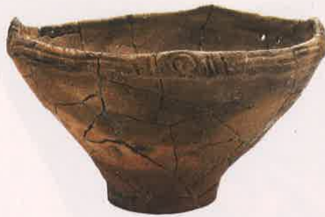
芥川遺跡 縄文土器 浅鉢