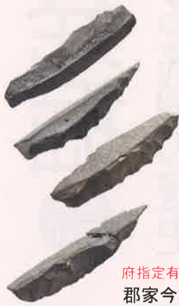
府指定有形文化財 郡家今城遺跡 ナイフ形石器