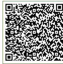
電子申込用二次元コード