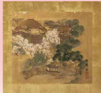
屏風に貼られた 京都名所絵