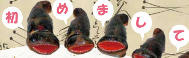
張り子のオオサンショウウオ