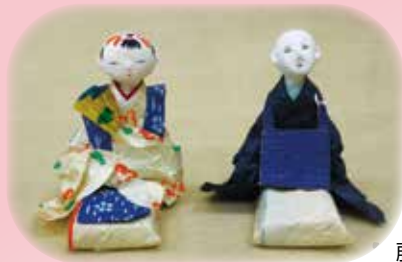
藤原孚石の和紙人形