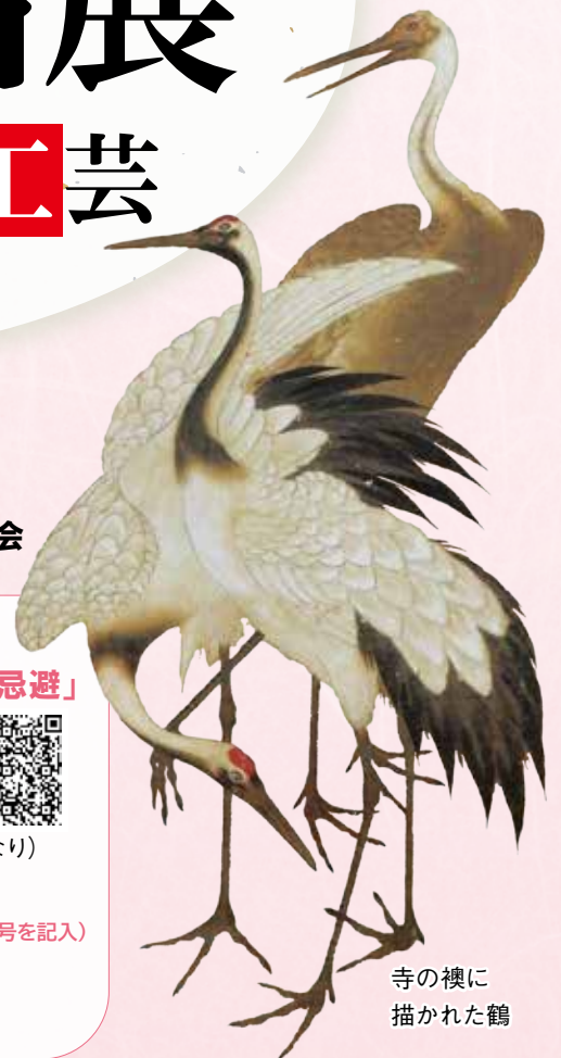
寺の襖に描かれた鶴

高槻市立 TAKATSUKISHIROATO HISTORICAL MUSEUM