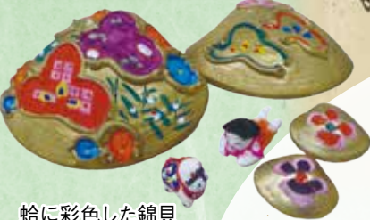
蛤に彩色した錦貝