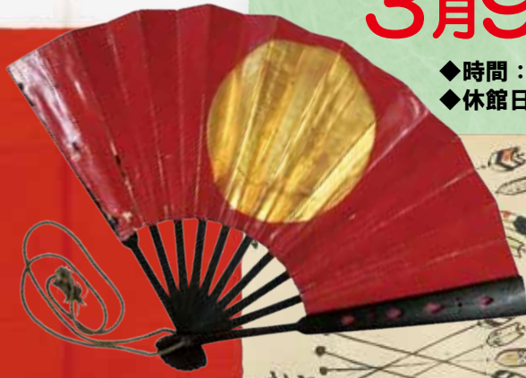
高槻藩士の旗指物と軍扇