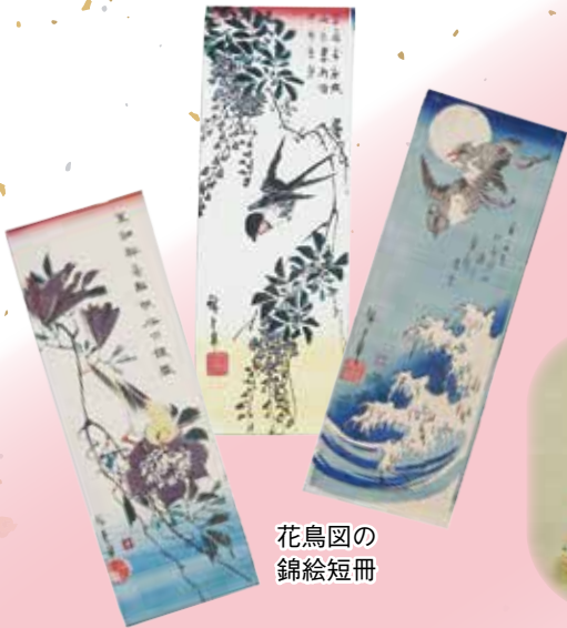
花鳥図の 錦絵短冊