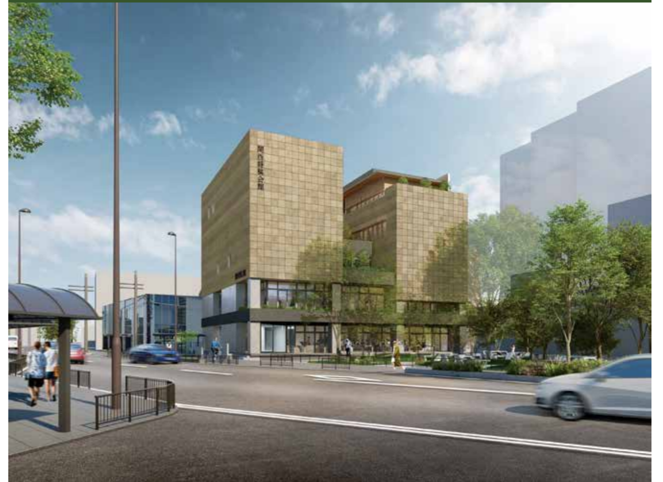
新関西将棋会館イメージパース図 提供: 日本将棋連盟

関西将棋会館建設プロジェクトは、高槻市のふるさと納税制度を活用し、集まったご寄附のうちサイト手数料を除く全額を日本将棋連盟にお渡しし、関西将棋会館の建設に役立てるものです。