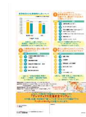
アンケート結果(表面・裏面)【高槻市】