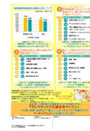
アンケート結果(表面・裏面)【大阪府】