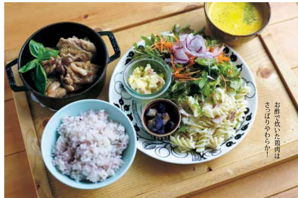
お酢で炊いた鶏肉は さっぱりやわらか!

ストウブで煮込むローマ風チキンカチャラは酸味の利いた大人味。大皿にはバジルが爽やかなマカロニサラダ、コクのあるサツマイモとクリームチーズのサラダ、ナスの香味オイルマリネなど、スープ、雑穀米ご飯、ドリンクバー付き¥1,260