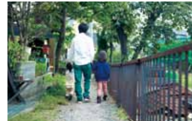
緑がキレイなカフェ前の小道を パパと一緒に散歩