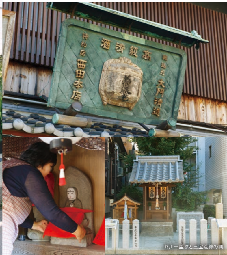
芥川一里塚と三宝荒神の祠