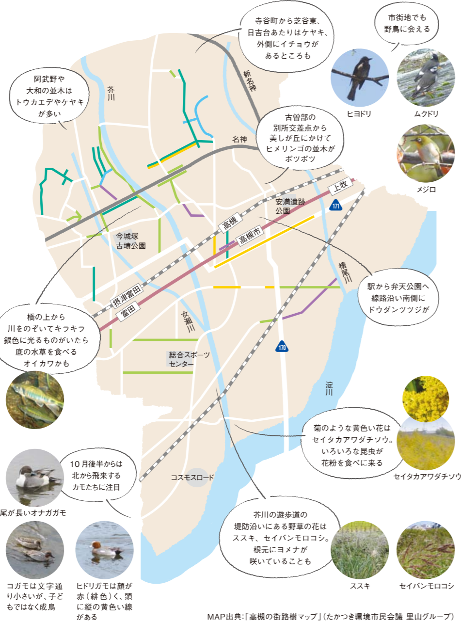
MAP出典:「高槻の街路樹マップ」(たかつき環境市民会議 里山グループ) ※平成29年10月製作

アメリカカワウ 真っ赤に紅葉。クリスマスオーナメントのようなトゲトゲの実がかわいい