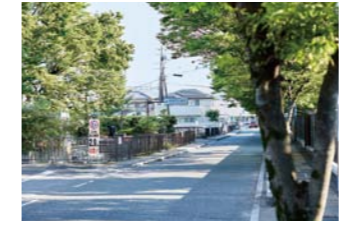
桃園町(水道部庁舎前)

まちなかを走ると街路樹のある道路が多いのに気付く。よく見ると、場所によって葉や木の形が違ってくる