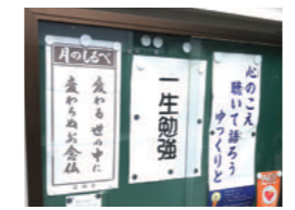
願行寺の鬼瓦には口が「あうん」になっている像が。「一生勉強」の掲示に深くうなづく