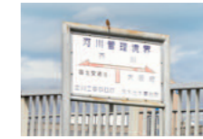
城西橋のたもとに河川管理境界の看板。ここから南は国土交通省、北は大阪府の管轄だそう