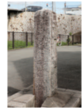
城西橋から下ったところにあった道しるべには「高槻街道 高槻山崎 京都」「高槻街道支線 高槻停車場 芥川」などの文字が