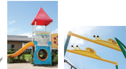
最近の公園は遊具が かわいくて「映え」る!