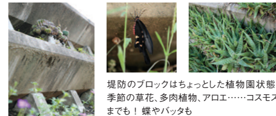
堤防のブロックはちょっとした植物園状態! 季節の草花、多肉植物、アロエ……コスモスまでも! 蝶やバッタも