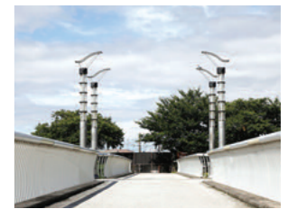
ゆりかもめがモチーフという芥川歩道橋の照明は左右対称でアートな感じ