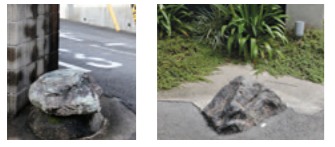
高槻にもある「いけず石」。家の角に置く車よけの石なのだそう