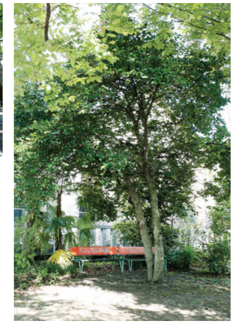
平日の庄所神社は静かで、市の樹林保護地区に指定されている緑の豊かさに圧倒される。木陰のなかには昭和なベンチが……