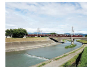
じっと見ると芥川の透明度の高さに気づく。大小たくさんの魚もあちこちに