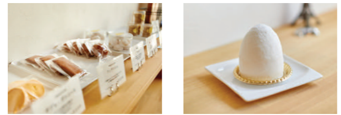
デザインや味を追求したケーキも、木のぬくもりがある店も、2人の理想を貫くため、駅前を避けて子ども時代を過ごしたなじみある地域に出店。店名はフランス語で「輝く店」の意味。看板商品は、店名を冠した純白のドーム状ムース「エクラ」

生クリームをブレンドして商品ごとに使い分け。甘さを抑えて素材の個性を輝かせるケーキは男性にも人気 (令和2年度採択) Memo Magasin de éclat 洋菓子販売・カフェ 明野町15-29